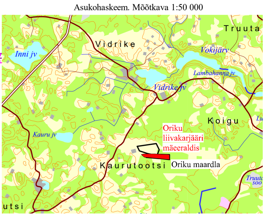
Alus, Eesti Baaskaart, leht 5414 ja 5423.